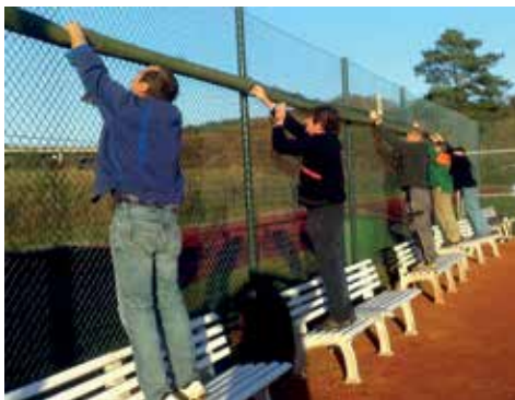
Alle Jahre wieder: Der Platzabbau