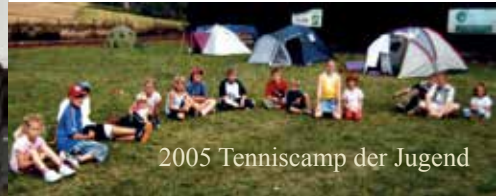
2005 Tenniscamp der Jugend