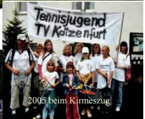
2005 beim Kirmeszug