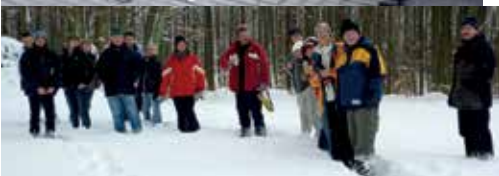
2011 Eine echte Winterwanderung